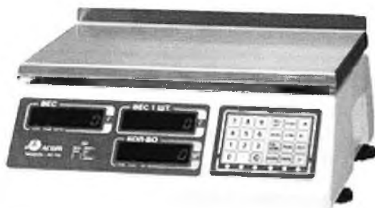
Рисунок 1 - Общий вид весов электронных АС-100.

Общий вид весов представлен на рисунке 1.